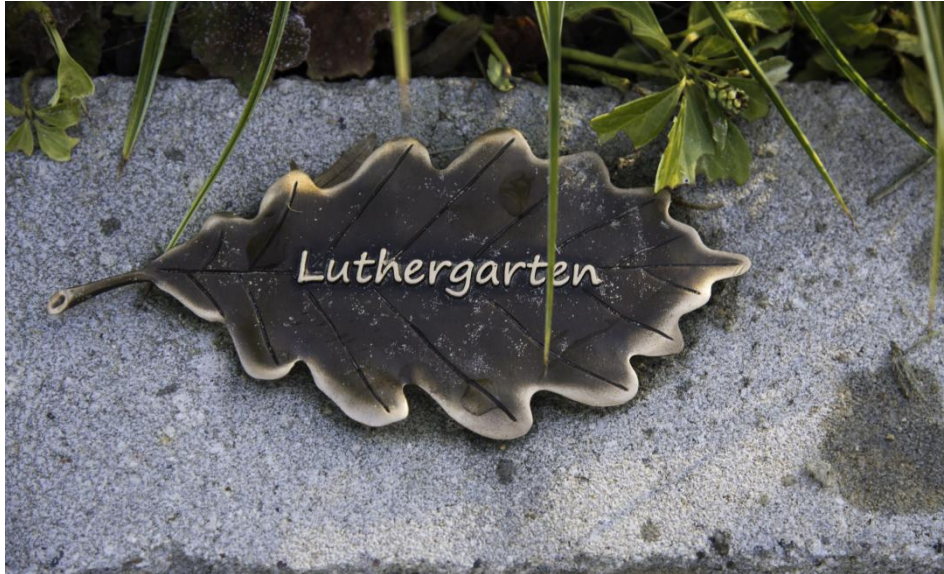
Bronzeblatt zur Aufnahme von Name, Geburts- und Sterbejahr